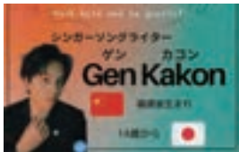
Gen Kakon (ゲンカコン)