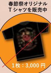
春節祭オリジナル Tシャツを販売中