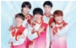
華 MEN 組