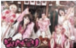
ジュリアナの祟り